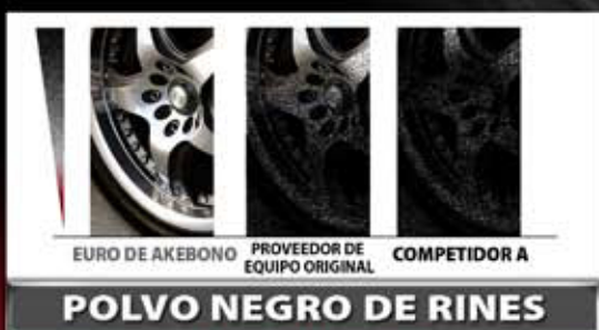
Después de 400 frenadas

■ EURO de Akebono ■ Proveedor de Equipo Original ■ Competidor A